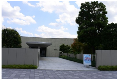
日清製粉グループ 製粉ミュージアム

日清製粉創設の地、館林、、、 群馬は、うどんや製粉で栄えた国内 有数の小麦産地です。(2017年全 国で第4位)創設時の貴重な資料 から現在の最新製粉技術を見学し てみませんか？